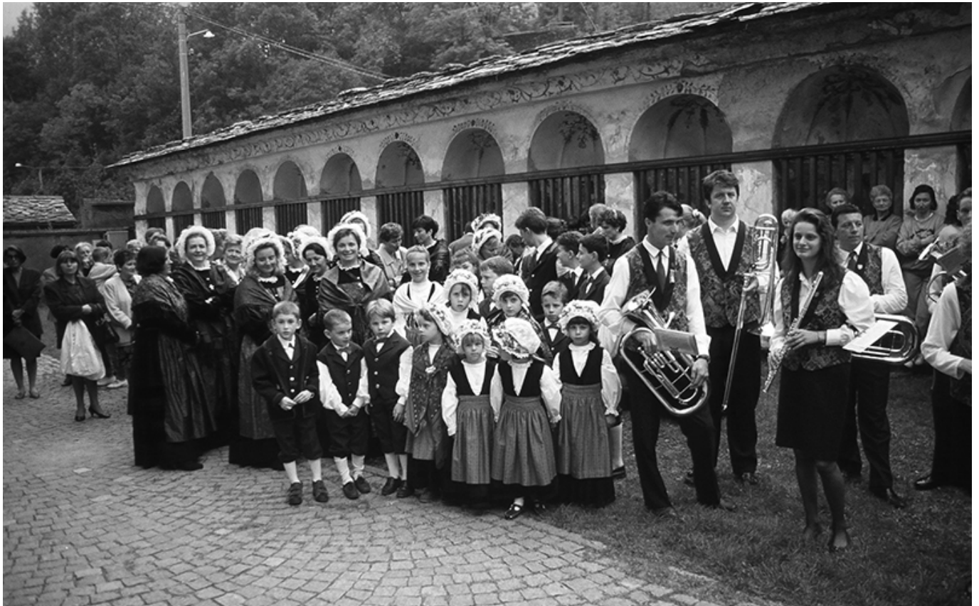
Èischeme: Walsetracht

Dopo la festa dei Santi e la commemorazione dei defunti, si risaliva con le mucche nelle baite di mezza montagna per consumare parte del fieno raccolto durante l'estate e qui ci si fermava fino all'inizio di dicembre. La festa di Santa Barbara concludeva questo periodo.