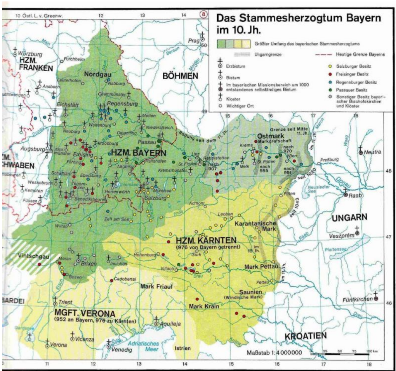
Das alte Stammesherzogtum Bayern Geschichtsatlas, Verlag: Cornelsen-Schulverlage

Im 11. Jh. hatte Bayern seine größte Ausdehnung. Zum Herzogtum Bayern gehörten im Süden das HZM, Kärnten und die MGFT. Verona. Das Kernland des Klosterlandes bzw. Klostergerichtes Benediktbeuern war relativ groß und existierte bis zur Säkularisation 1803.